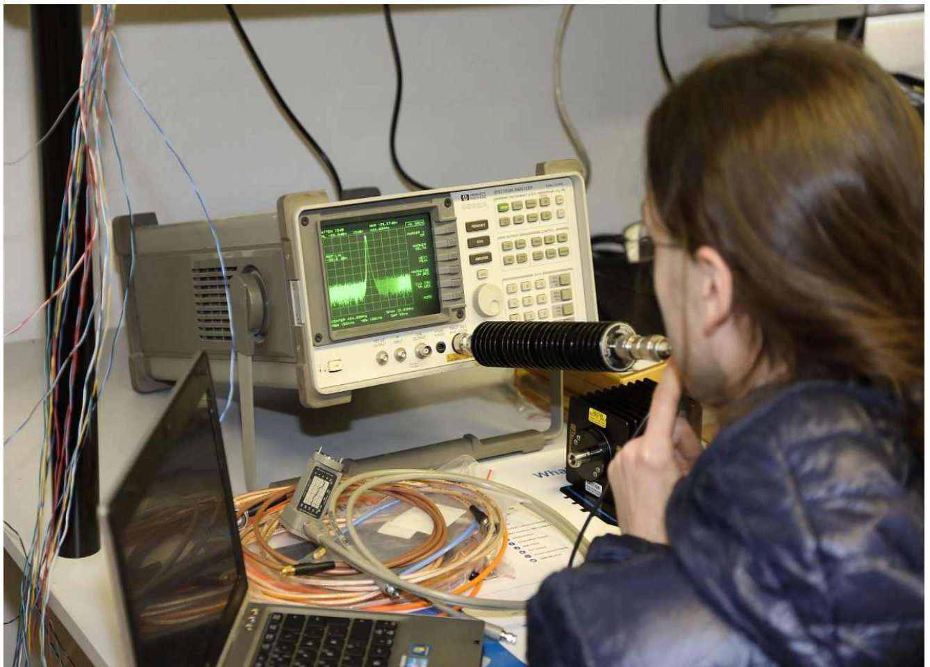
Das Spektrum ist ok....