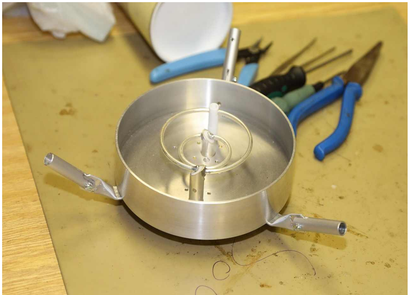
Der „Futternapf“ für den Parabolspiegel ist fertig ;-)