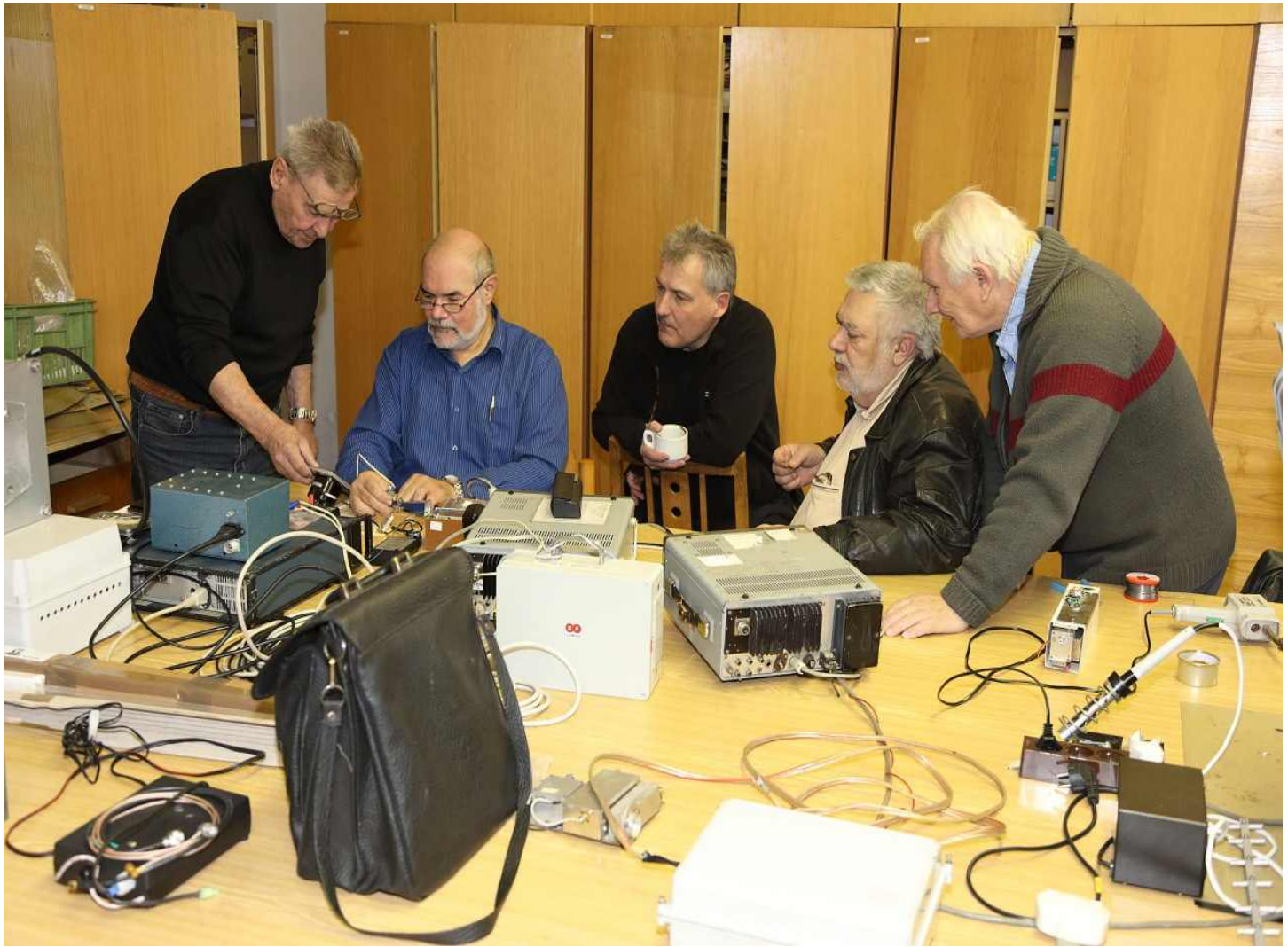
Hier geht es um einen Detektor für 24GHz